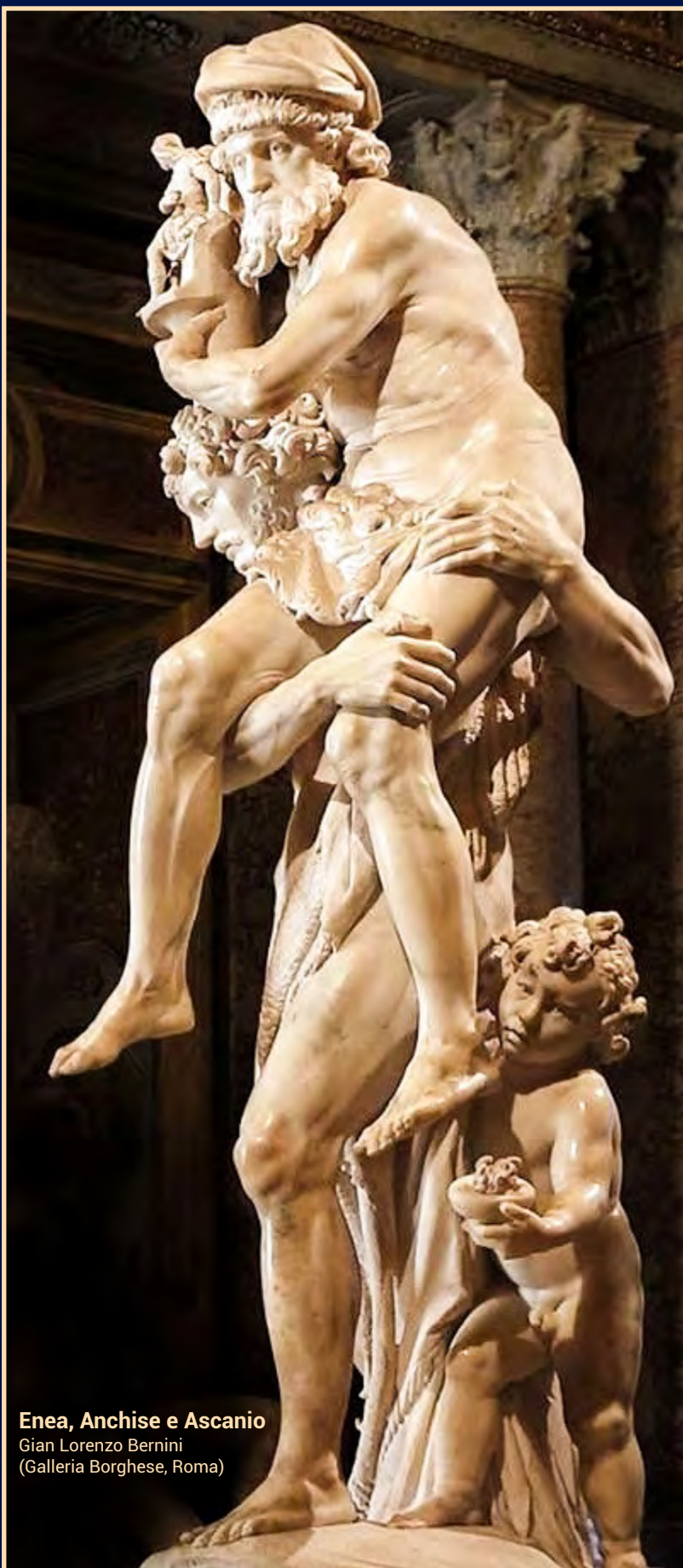
Enea, Anchise e Ascanio Gian Lorenzo Bernini (Galleria Borghese, Roma)