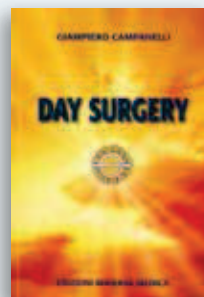
Giampiero Campanelli Day Surgery

Disamina chiara e puntuale di tecnica e gestione del "day surgery", il volume curato dal dott. Giampiero Campanelli, è uno strumento che potrà essere agilmente utilizzato da chirurghi e medici di base per un approccio sia tecnico che organizzativo alla prassi dell'intervento chirurgico senza ricovero. Il volume si apre con l'evoluzione della day surgery in Italia, per poi esaminare elementi organizzativi e tecnici, tra i quali di primaria importanza rivesta il tema della qualità, e chiudere con l'applicazione della tecnica chirurgica in day surgery nelle varie branche (chirurgia generale, vascolare, ortopedia, senologia, urologia, otorinolaringoiatria ecc.).