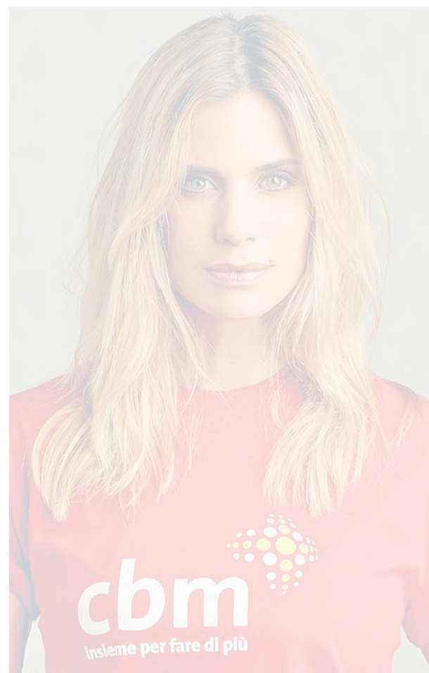
Filippa Lagerback

Al via la seconda edizione della campagna «Ridisegniamo l'emofilia», promossa da Roche Italia con il patrocinio della Federazione delle Associazioni Emofilici (FedEmo) e della Fondazione Paracelso Onlus, con l'obiettivo di continuare a dare spazio ad un racconto positivo dell'emofilia. Tra le iniziative, la partecipazione alla Color Run (info www.ridisegnamolemofilia.it ).